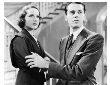
1935 PRODIGE (Spendthrift) de Raoul Walsh avec Henry Fonda