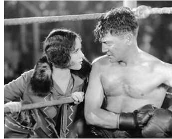
1927 KNOCKOUT REILLY de Malcolm St. Clair avec Richard Dix