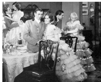
1930 PARAMOUNT ON PARADE d'Edmund Goulding avec Gary Cooper, Richard Arlen