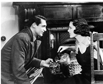
1936 LA CHASSE AUX MILLIONS (The amazing quest of Ernest Bliss) d'A. Zeisler avec C. Grant