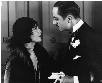
1928 VISAGES OUBLIÉS (Forgotten Faces) de Victor Schertzinger avec William Powell