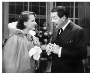
1934 CHARLIE CHAN À PARIS (Charlie Chan in Paris) de Lewis Seiler avec Warner Oland