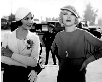
1933 GIRL MISSING de Robert Florey avec Glenda Farrell