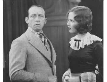
1928 DEUX HONNÊTES FRIPOUILLES (Partners in Crime) de Frank R. Strayer avec Raymond Hatton