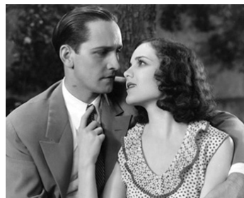
1929 THE MARRIAGE PLAYGROUND de Lothar Mendes avec Fredric March