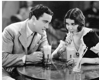
1928 VARSITY de Frank Tuttle avec Charles Buddy Rogers