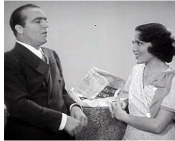
1932 LA TOUR DE MANHATTAN (Manhattan Tower) de Frank R. Strayer avec James Hall