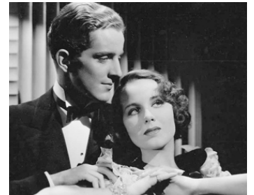
1934 SCANDALE PRIVÉ (Private Scandal) de Ralph Murphy avec Phillips Holmes