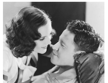
1930 THE SOCIAL LION d'A. Edward Sutherland avec Jack Oakie