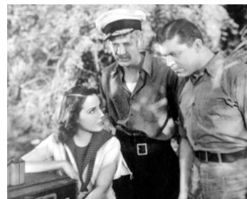
1937 THE AFFAIRS OF CAPPY RICKS de Ralph Staub avec Walter Brennan, Lyle Talbot