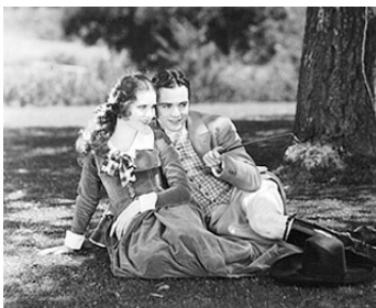
1929 CAPITAINE BLAKE (River of Romance) de Richard Wallace avec Charles Buddy Rogers