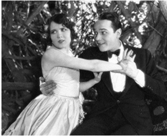
1926 TOM, CHAMPION DU STADE (Brown of Harvard) de Jack Conway avec William Haines