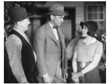
1931 GUN SMOKE d'Edward Sloman avec William Boyd