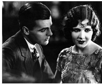
1925 L'ÉCOLE DES MENDIANTS ( The Street of forgotten Men) d'H. Brenon avec Neil Hamilton