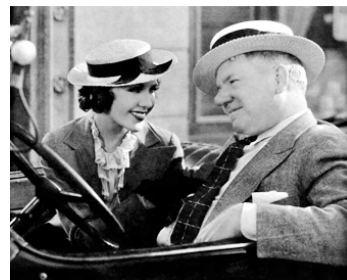
1935 LES JOIES DE LA FAMILLE (The Man of the flying Trapeze) de C. Bruckman avec W.C. Fields