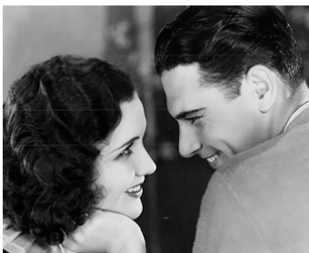
1929 PLEIN GAZ (Burning up) d'A. Edward Sutherland avec Richard Arlen