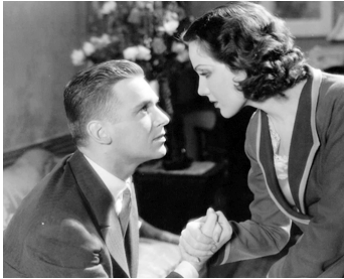
1932 IT'S TOUGH TO BE FAMOUS d'Alfred E. Green avec Douglas Fairbanks Jr