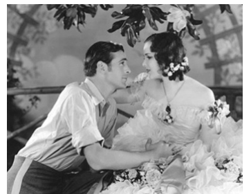
1929 ONLY THE BRAVE de Frank Tuttle avec Gary Cooper