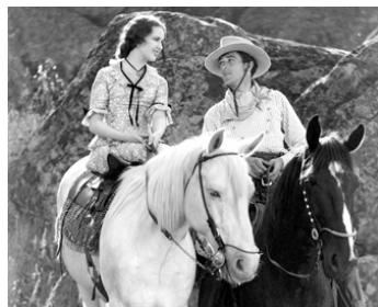
1929 LE VIRGINIEN (The Virginian) de Victor Fleming avec Gary Cooper