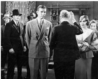
1933 SHADOWS OF SING SING de Phil Rosen avec Harry Woods, Bruce Cabot