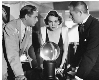
1934 BROUILLARD (Fog) d'Albert S. Rogell avec Donald Cook, Reginald Denny