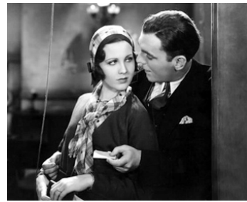
1931 SPÉCIALE PREMIÈRE (The front Page) de Lewis Milestone avec Pat O'Brien