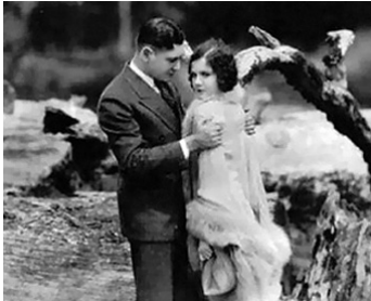
1927 MAN POWER de Clarence C. Badger avec Richard Dix