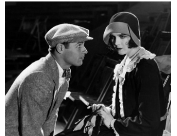
1929 L'HOMME QUE J'AIME (The Man I love) de William A. Wellman avec Richard Arlen