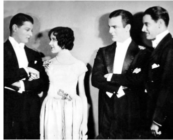
1926 BEAU GESTE d'Herbert Brenon avec Ralph Forbes, Neil Hamilton, Ronald Colman