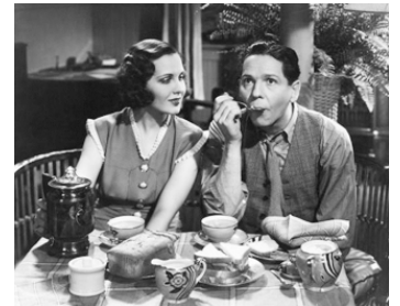
1933 AMOUR ET CLAIR DE LUNE (Moonlight and Pretzels) de Karl Freund avec Roger Pryor