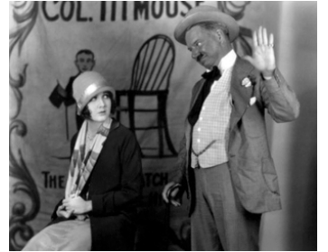
1927 DANS LA PEAU D'UN LION (Running Wild) de Gregory La Cava avec W. C. Fields