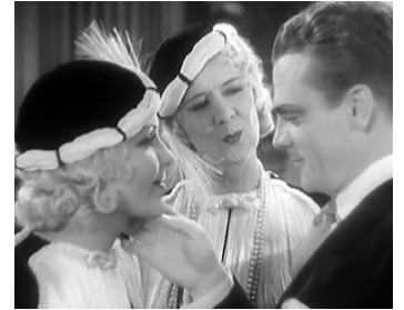
1932 L'AFFAIRE SE COMPLIQUE (Hard to handle) de Mervyn LeRoy avec James Cagney