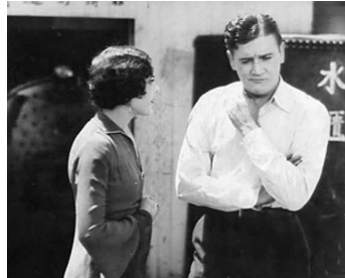
1927 MAÎTRE APRÈS DIEU (Shanghai Bound) de Luther Reed avec Richard Dix