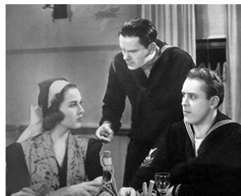
1937 RUSTY LE VANTARD (Navy Blues) de Ralph Staub avec Warren Hyner, Dick Purcell