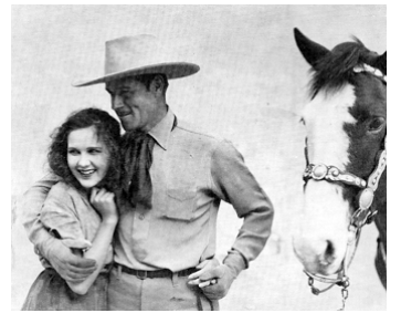
1926 LA COLLINE ENCHANTÉE (The enchanted Hill) d'Irvin Willat avec Jack Holt