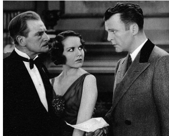
1933 LE MONDE VA MAL (The World gone mad) de C. Cabanne avec N. Hamilton, John St. Polis