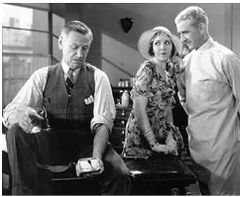
1930 ONLY SAPS WORK de Cyril Gardner & Edwin Knopf avec George Irving, Charley Grapewin