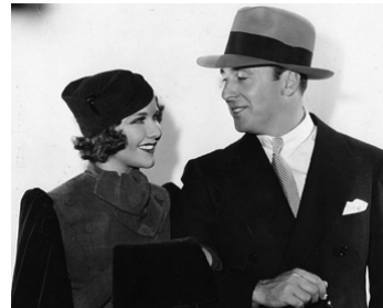
1934 TOUJOURS LA FEMME (Ever since Eve) de George Marshall avec George O'Brien