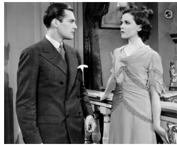
1930 THÉÂTRE ROYAL (The Royal Family of Broadway) de G. Cukor avec Charles Starrett